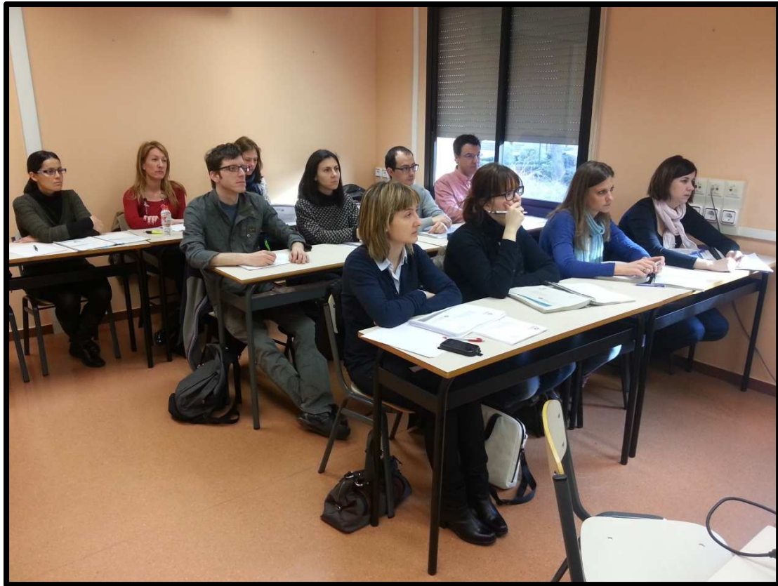
Foto2: visió global dels assistents al curs